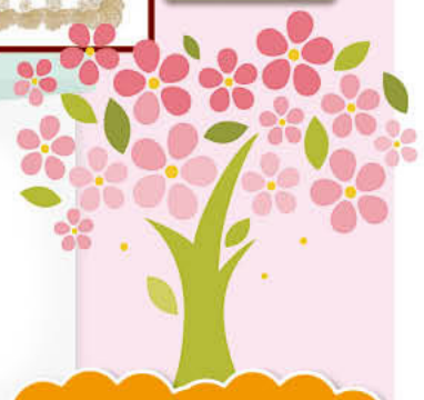
あけみちゃんと ゆかいな仲間達による スコープ三味線

今年は 百寿 1人 米寿 12人 喜寿 3人 (入所・通所合計) 16人の方々のお祝いを させていただきました。