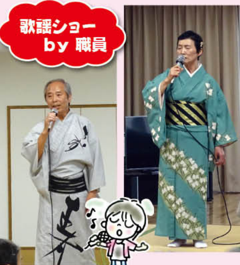
歌謡ショー by 職員

今年は 百寿 1人 米寿 12人 喜寿 3人 (入所・通所合計) 16人の方々のお祝いを させていただきました。