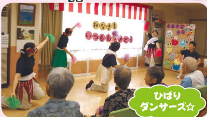
ひばり ダンサーズ☆