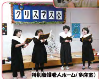
特別養護老人ホーム (多床室)