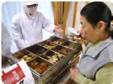
おでんバイキング

また、各部署の要望に合わせて、バイキング、手打ちそば実演、シルバークッキング等、食に関するイベントを開催しています。