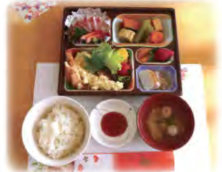
【上】新年祝賀会（養護）