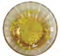
【右】11月行事 菊の花ゼリー （特養多床室）