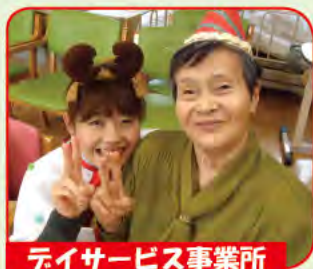
デイサービス事業所