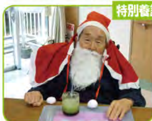
特別養護老人ホーム (ユニット)