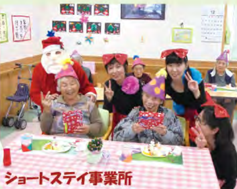
ショートステイ事業所

12 月 24 日 (木) 養護老人ホームでは、毎年恒例の忘年会が開催されました。