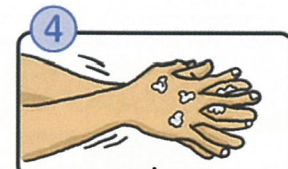
指の間を洗います。