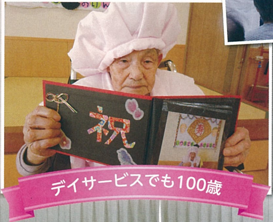
デイサービスでも100歳