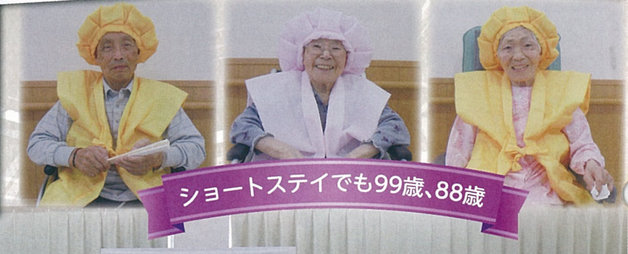
ショートステイでも99歳、88歳