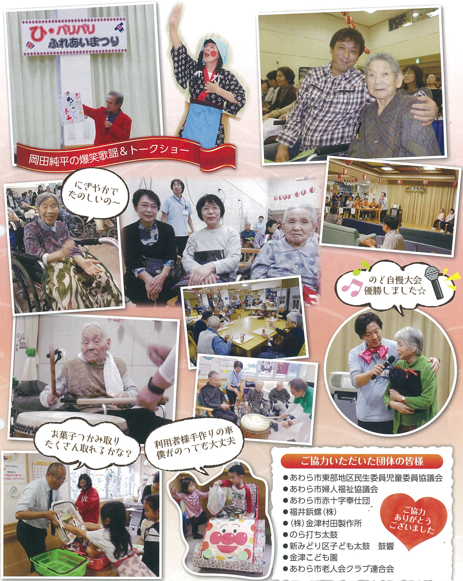
岡田純平の爆笑歌謡&トークショー