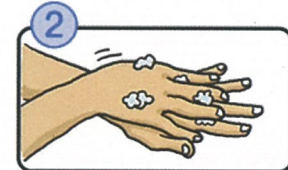
手の甲をのぼすようにこすります。