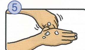
親指と手のひらをねじり洗います。