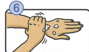
手首も忘れずに洗います。

石けんで洗い終わったら、十分に水で流し、清潔なタオルやペーパータオルでよく拭き取って乾かします。