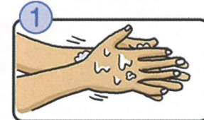
流水でよく手をぬらした後、石けんをつけ、手のひらをよくこすります。