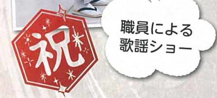
職員による歌謡ショー