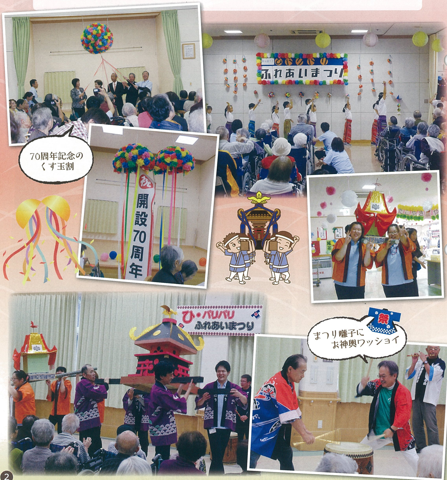
70周年記念のくす玉割

これからも「地域の皆様に支えられる雲雀」であり続けられるようご支援のほどよろしくお祈りします。