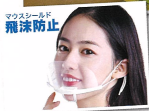
入浴介助の時はマウスシールドを着用しております。